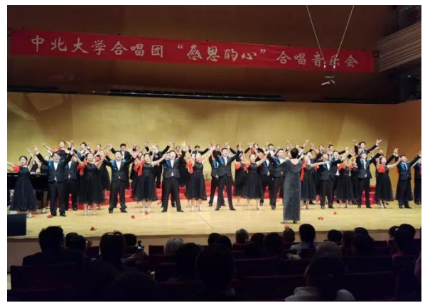
中北大学合唱团“感恩的心”合唱音乐会在山西大剧院演出