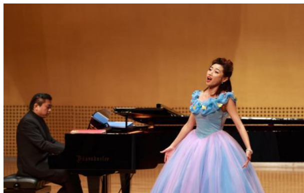
专业教师在山西大剧院演绎“永恒的旋律”声乐作品音乐会