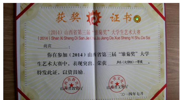
声乐组美声“一等奖”