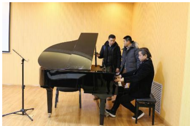
中北大学与雅马哈（中国）签订有关高校音乐类奖学金的协议

中北大学是“雅马哈亚洲音乐奖学金”在山西艺术类院校中选定的首家、也是唯一一家合作院校。“雅马哈亚洲音乐奖学金”成功落户于中北大学，必将极大地促进山西省音乐学科的建设水平，培养出更多高素质的音乐人才