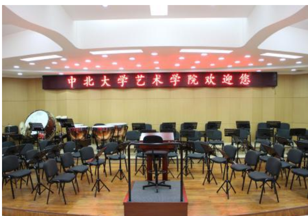
多功能音乐乐器排练厅