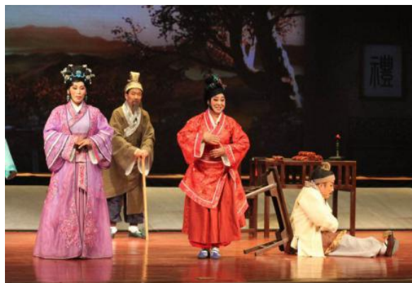
国家艺术基金资助项目《孟母三迁》秧歌剧演出