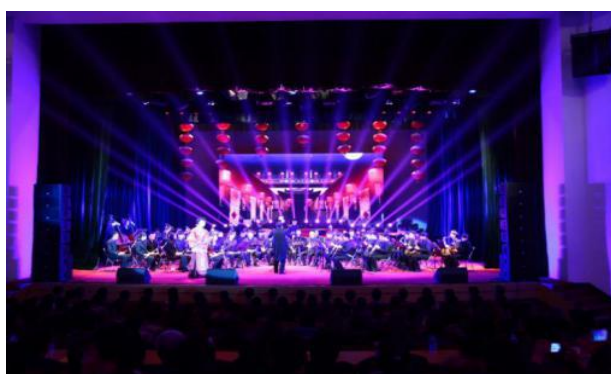
中国军工文化艺术团赴各地军工类企业开展汇报演出