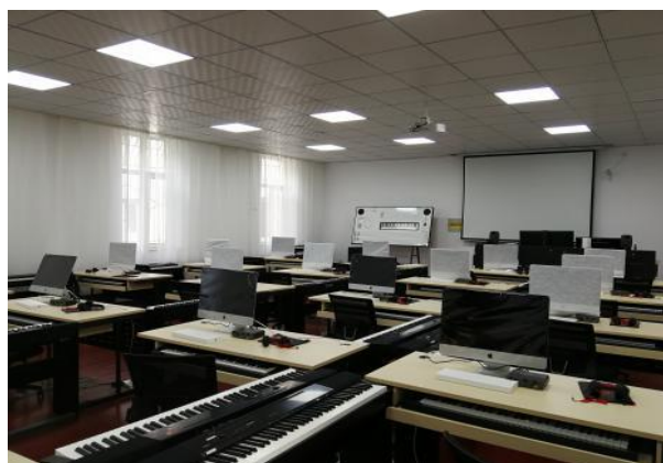
音乐制作与试听实验室