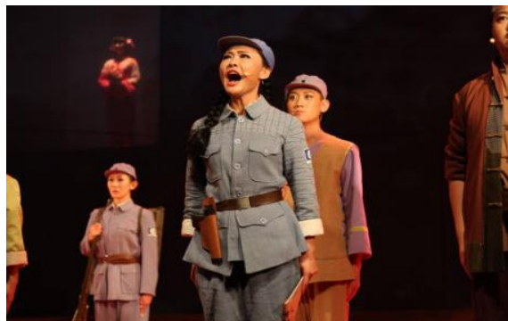
国家艺术基金资助项目《太行花》儿童剧演出