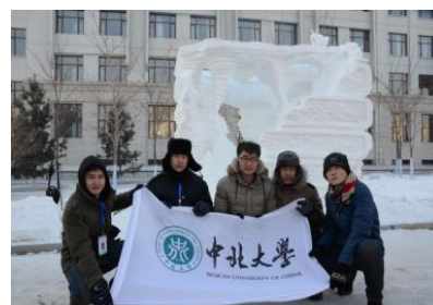
第八届大学生雪雕大赛荣获全国一等奖