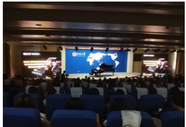
“雅马哈亚洲音乐奖学金”启动仪式音乐会及大师班在中北大学成功举行