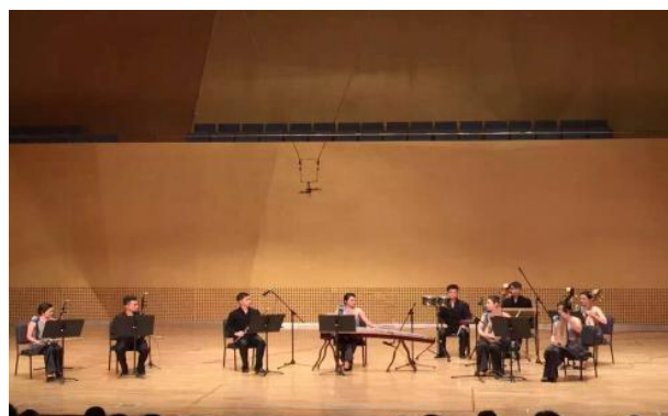
寒泉室内乐团在山西大剧院演出