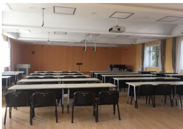
多功能音乐教学录播厅