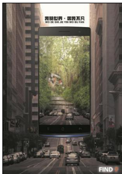
本专业学生参加大广赛获得全国三等奖的设计作品