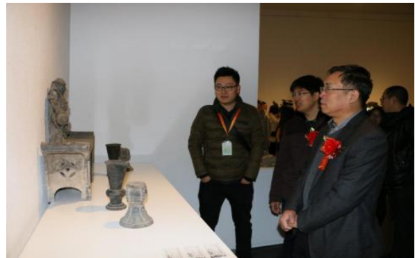
国家艺术基金资助项目《晋派传承》砖雕艺术作品展