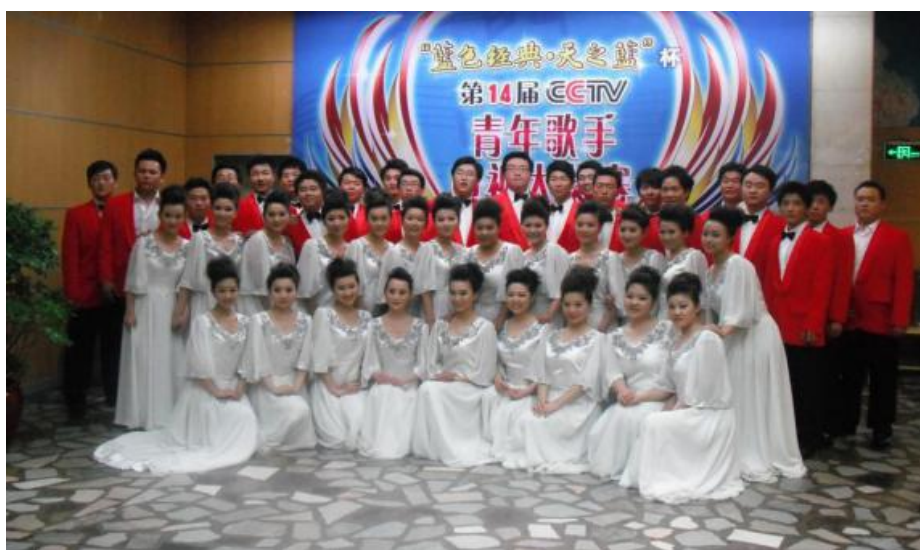
合唱团参加第十四届 CCTV 青年歌手大奖赛获铜奖

中北大学合唱团曾获国家大剧院 2008 年首届世界民歌博览周“艺术成就奖”，教育部 2009 年第二届“大学生艺术展演”比赛二等奖，代表海军政治部文工团参加“第十四届 CCTV 青年歌手大奖赛”获“铜奖”等，并多次参加中央电视台及国内相关单位的演出活动，同时学生在美国、澳大利、新加坡等国内外专业比赛中屡获嘉奖。设计类专业学生在第八届国际大学生雪雕大赛中获一等奖，并获组委会特别嘉奖“最佳创意奖”；在 2016 年中国大学生第九届计算机设计大赛中获一等奖 1 项，二等 5 项，三等奖 12 项；在第六届、第七届、第八届全国大学生广告艺术大赛中连续获得国家三等奖等其它各类奖项。