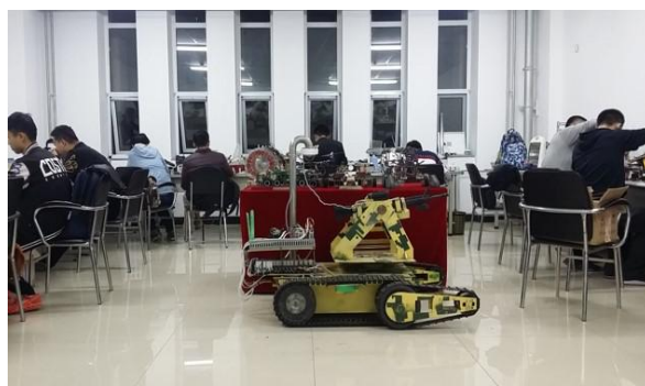
地面无人系统创新实验室

学生毕业后，可在国防工业所属的军工企业、科研院所从事装甲车辆及零部件的设计、制造、试验等工作，也可从事普通机械、汽车的设计和制造等工作。