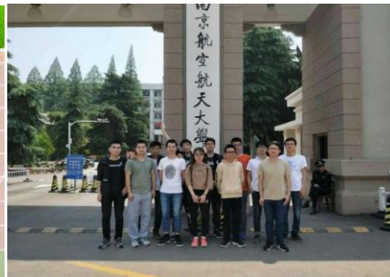
2017届有12名学生考入南京航空航天大学攻读研究生