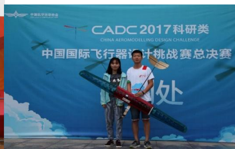
中国国际飞行器设计挑战赛