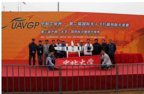
中航工业杯无人飞行器创新大赛

本专业毕业生可从事航空、航天、兵器及其它国防单位的飞行器设计以及机械设计领域的技术研发工作，也可在深造后从事航空航天科学理论前沿技术研究工作。