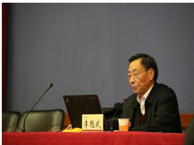
杰出校友 中国工程院院士李魁武为学生做专题报告

机电工程学院（武器装备技术学院）是我校国防军工特色鲜明的学院，学科专业办学实力雄厚，教育教学条件优越，是山西省教育系统先进集体，山西高校思想政治工作先进单位，拥有山西省优秀教学团队和山西省精品课程。学院现有“兵器科学与技术”一级学科博士点、硕士点，“机械工程”一级学科博士点、硕士点，航空宇航科学与技术一级硕士点；有“兵器工程”、“机械工程”、“航天工程”专业领域工程硕士学位授权点；拥有“兵器科学与技术”、“机械工程”博士后流动站。