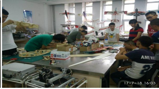
无人机创新实验室