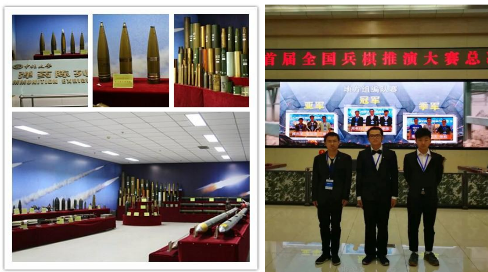
弹药陈列室实物图 学生获全国兵棋推演大赛地方组全国第一名