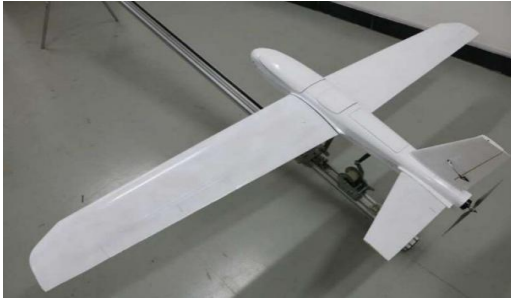
自主设计的复合材料固定翼无人机