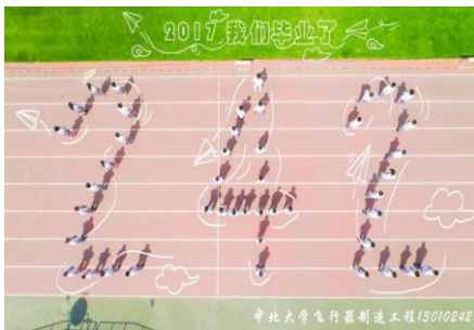
无人机拍摄毕业照

本专业毕业生可在飞行器制造工程、机械工程等相关领域的生产企业、科研单位、管理部门和部队从事工程研制、技术开发、产品制造、实验测试和科技管理等方面的工作。