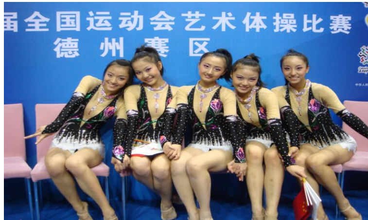
我院艺术体操队获第十届全国运动会团体第六名