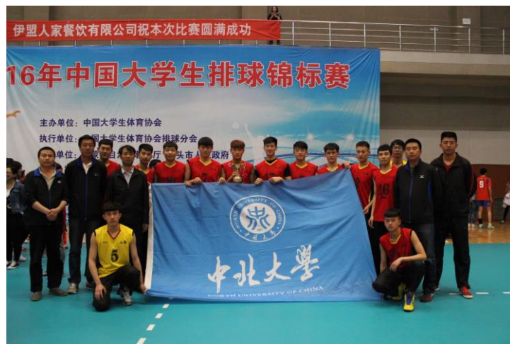
2016 全国大学生联赛第八名