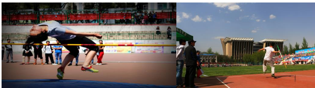
校园运动会精彩瞬间