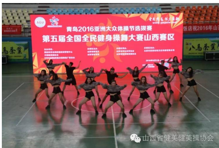
近年来中北健美操征战省内外多项赛事，成绩优异多次蝉联冠军