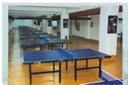
50 张球桌乒乓球场馆