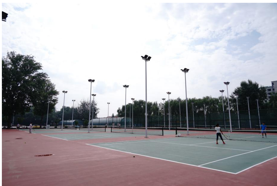
拥有 15 片灯光网球场