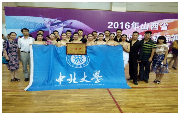
中北舞蹈队参加“山西省学生运动舞蹈锦标赛”靓丽夺冠