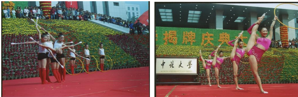
艺术体操队校庆表演