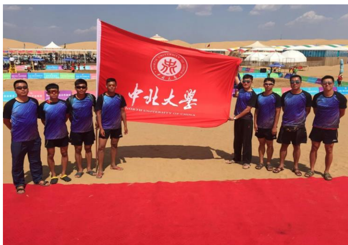
全国大学生沙滩排球锦标赛上取得优异的成绩，2011、2015、2016 三次夺得冠军