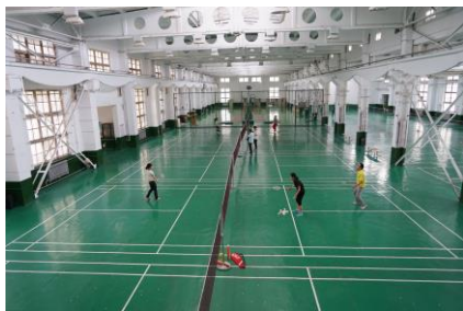
综合体育馆、羽毛球场馆